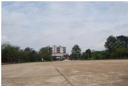
๓) ลานฝึกเอนกประสงค์