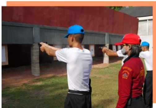
๕) สนามฝึกยิงปืนพก