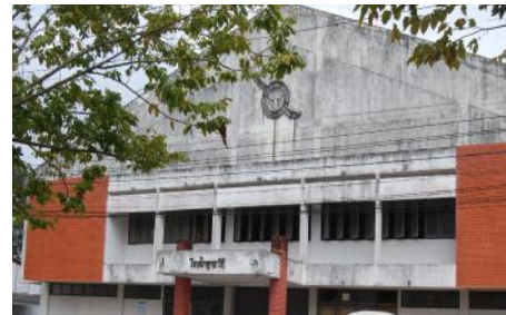
๔) โรงฝึกยุทธวิธี